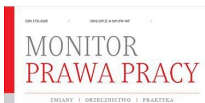
Monitor Prawa Pracy