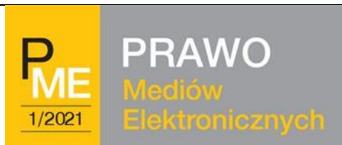
Prawo Mediów Elektronicznych