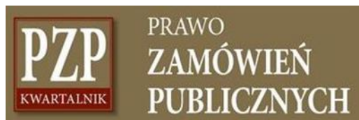
Prawo Zamówień Publicznych