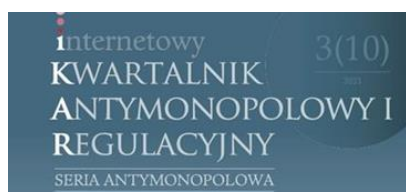
Internetowy Kwartalnik Antymonopolowy i Regulacyjny