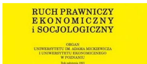
Ruch Prawniczy, Ekonomiczny i Socjologiczny