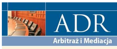
ADR Arbitraż i Mediacja