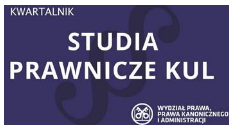
Studia Prawnicze KUL