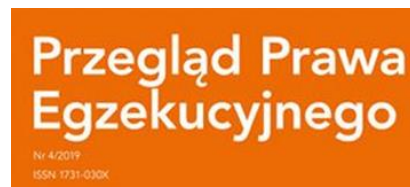
Przegląd Prawa Egzekucyjnego